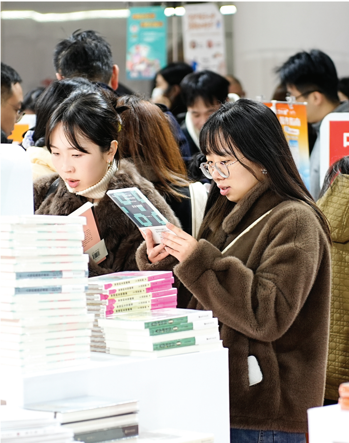
19日上午,2025中国文学盛典·湖南文学周暨第四届岳麓书会在长沙启幕。