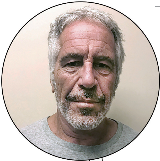
▲爱泼斯坦。