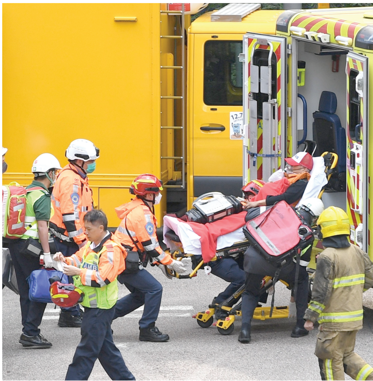
11月26日下午，香港新界大埔屋邨宏福苑多栋住宅楼发生火灾，造成重大人员伤亡。11月27日，香港特区政府消防处公布数据显示，截至22时，香港新界大埔火灾已造成75人遇难，另有76人受伤。图为11月27日救援人员从火灾现场运出伤者。