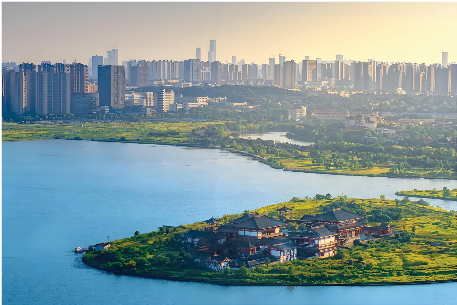
湖南松雅湖国家湿地公园。图/文旅星沙微信公众号

行账户,再由单位发放给个人,时间长、手续较为复杂。 湖南省15个医保统筹区中,已有长沙、株洲、湘潭、衡阳、岳阳、常德、郴州、永州、邵阳9个统筹区实现生育津贴直达个人,平均到账时间从2个月缩短至15个工作日。湖南省医保部门相关负责人表示,直发模式通过打通医保系统与个人账户的直通渠道,将建立起医保基金与参保人之间的“最短支付路径”,既杜绝了中间环节的权益损耗,也让参保人获得更直接的确定性与安全感,是生育保障服务从“管理型”向“服务型”转变的体现。