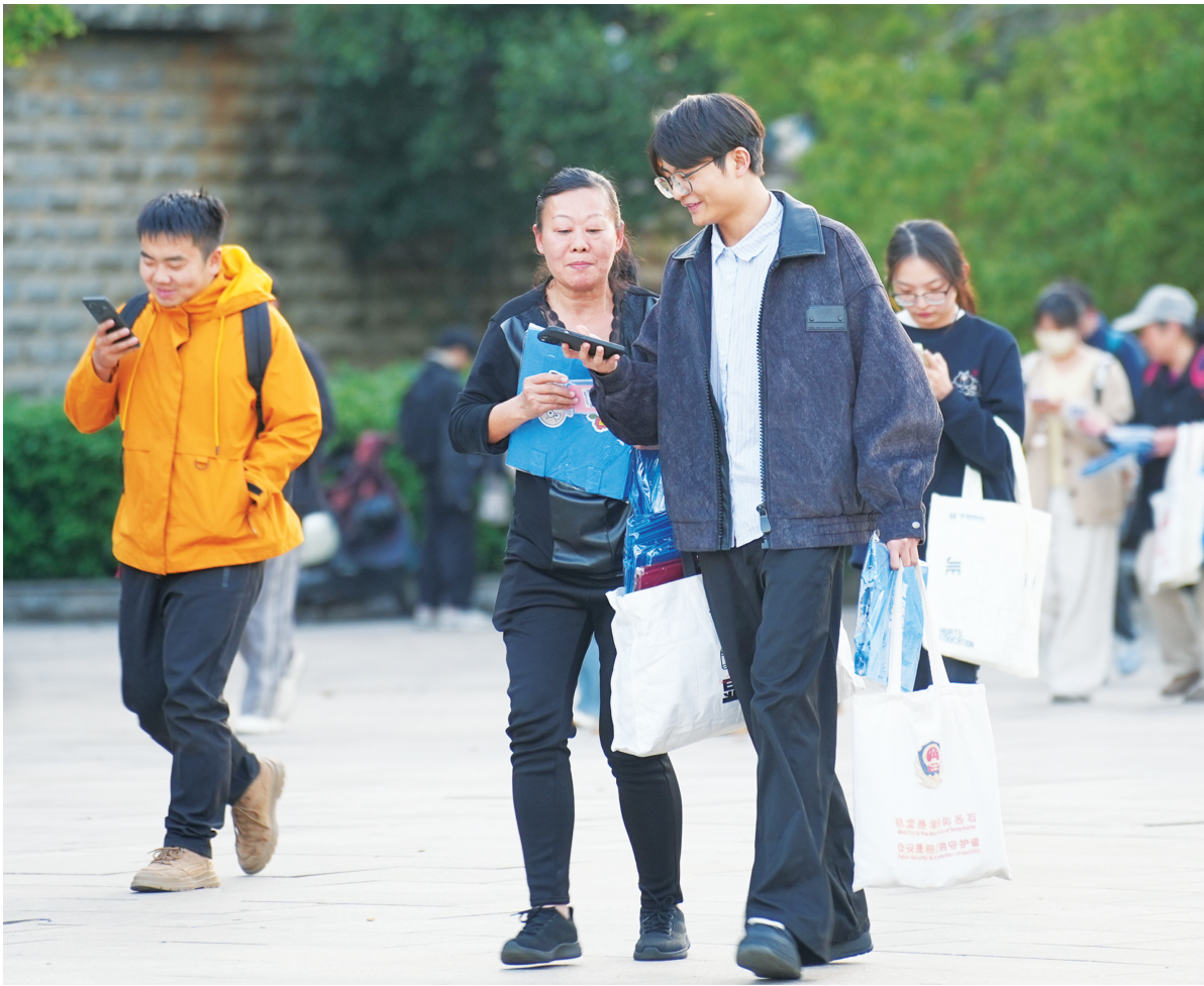
2026年国考笔试完成后,有考生面带笑容离开。