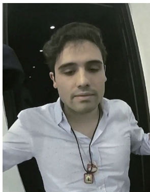
2019年10月,奥维迪奥在墨西哥被捕。