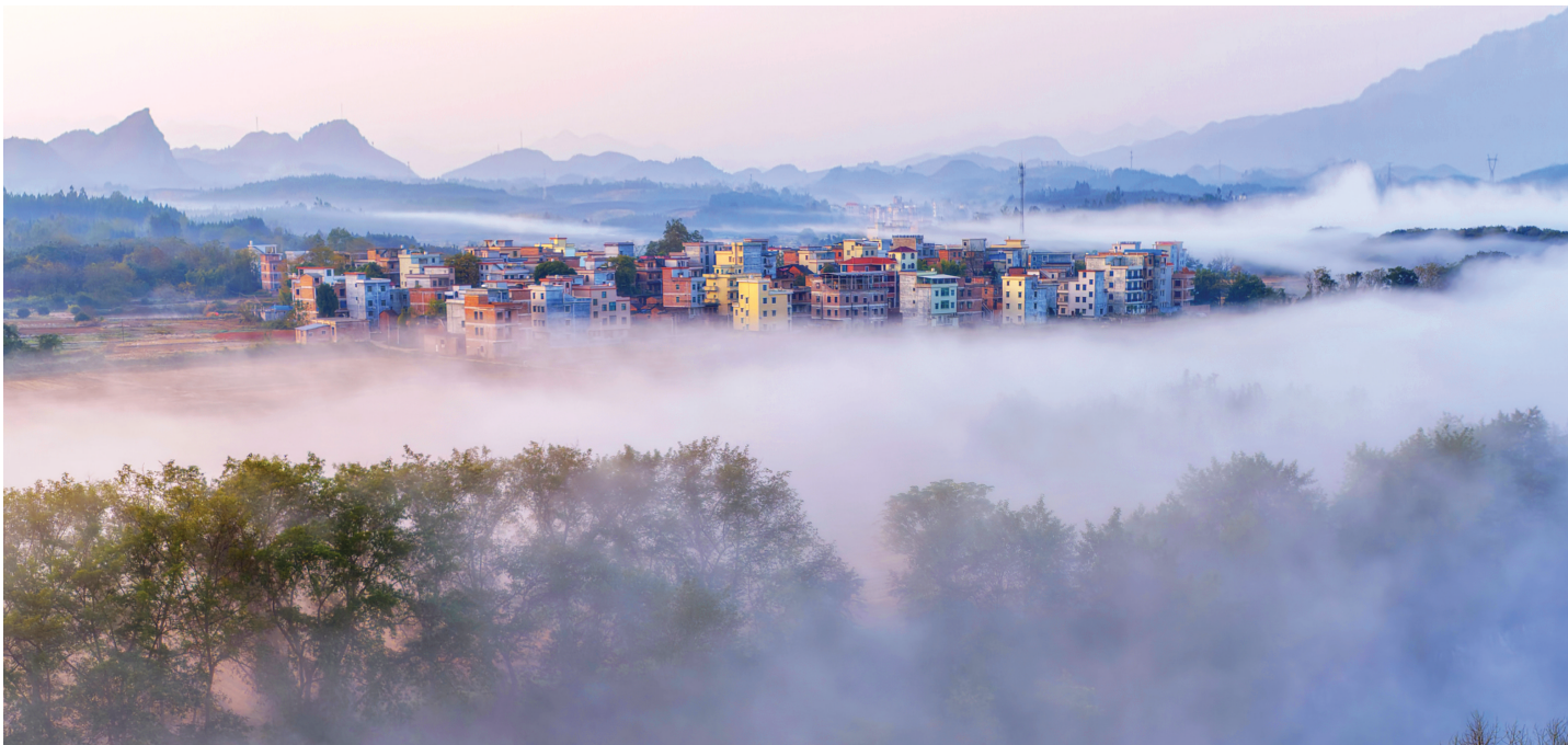
12月8日,郴州市嘉禾县晋屏镇,晨雾弥漫,山村如画。

下一步,湖南将认真落实省委十二届九次全会精神,锚定加快建设农业强省目标,坚持农业农村优先发展,促进城乡融合,持续巩固拓展脱贫攻坚成果,推动农村基本具备现代生活条件,全面提升农业综合生产能力和质量效益,加快建设宜居宜业的“和美湘村”。