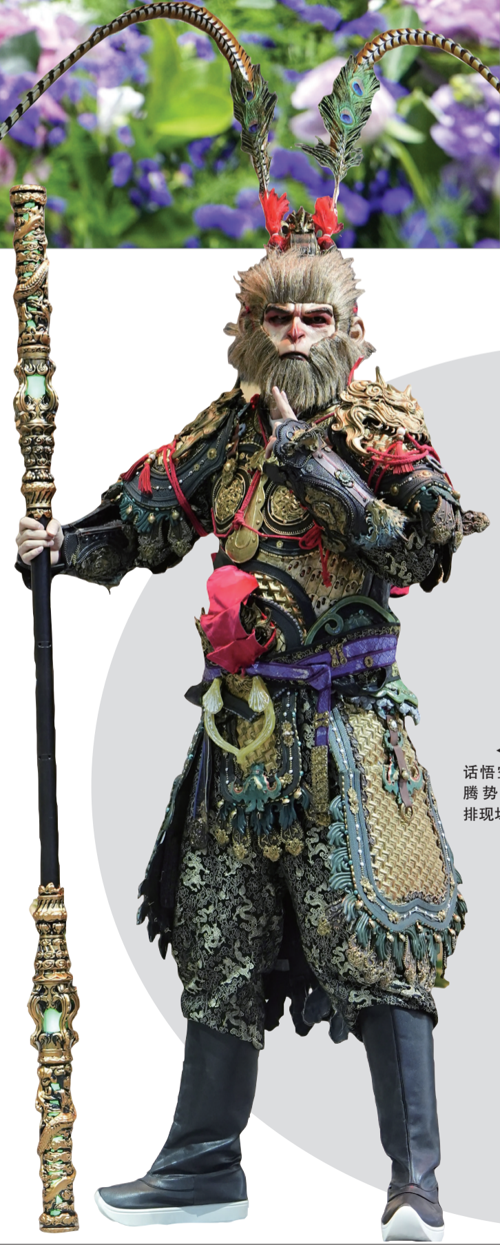
“黑神话悟空”现身车展舞台排场。

智能不止于科技，更在于融入日常。比亚迪智能化体验的最后一环，是否也能打动你？12月10日至15日，欢迎亲临长沙国际车展中心，在第二十一届中国（长沙）国际汽车展现场，感受智能科技如何悄然改变出行。