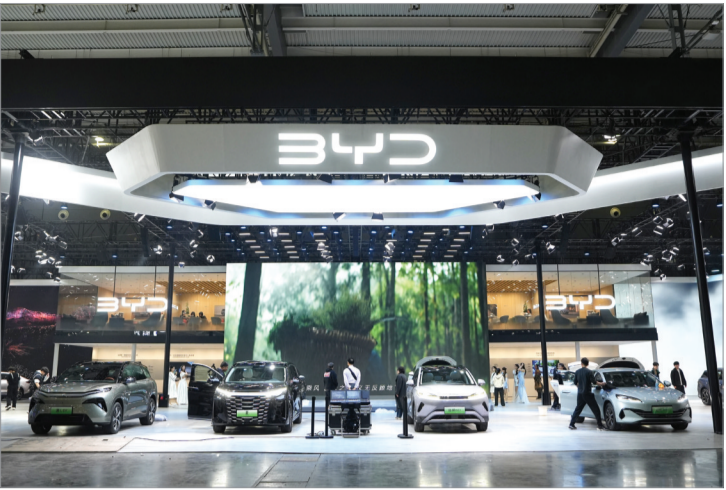
比亚迪展台的布展工作正在紧锣密鼓地进行中。