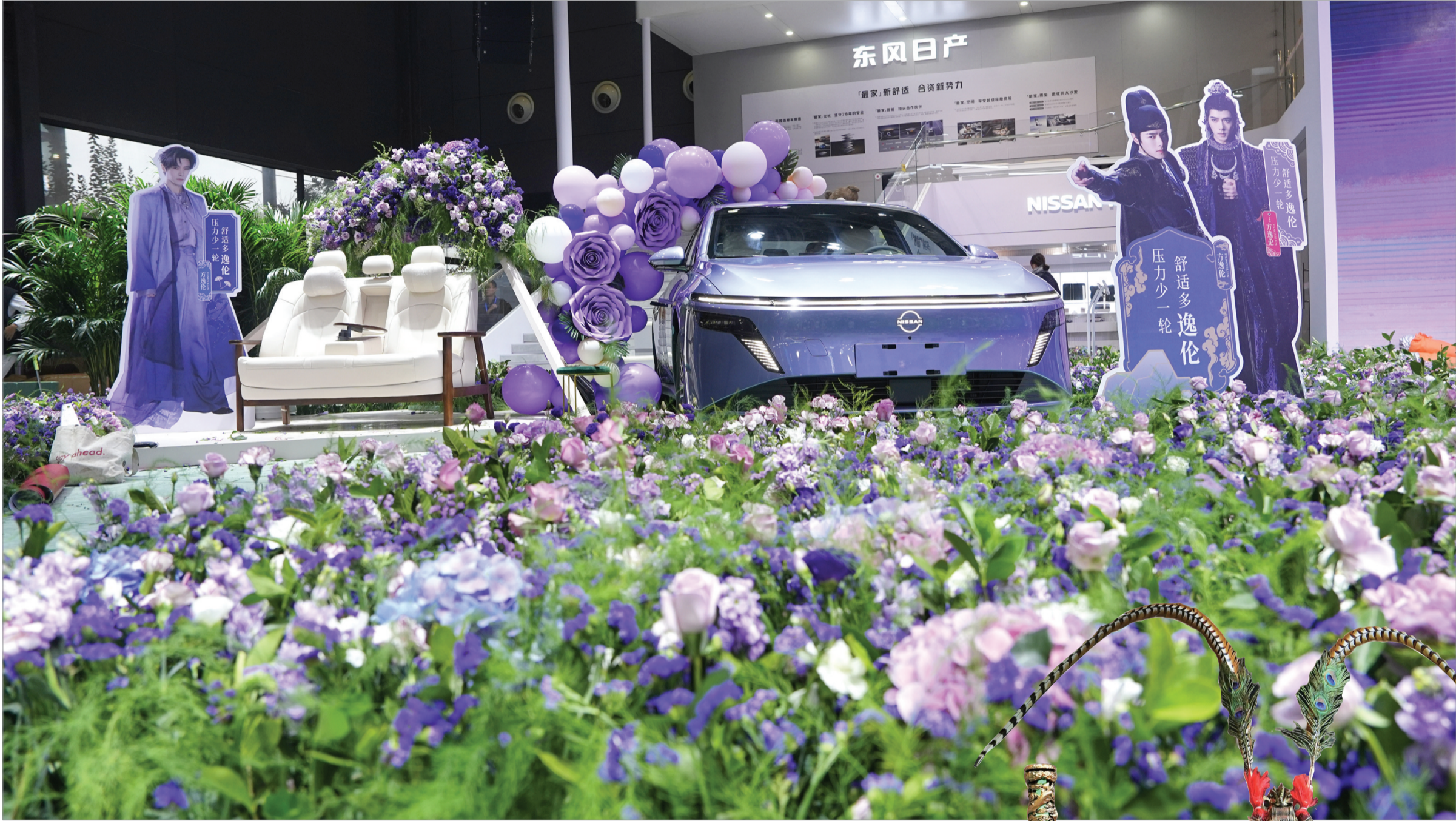
12月9日，长沙国际会展中心，东风日产带来了超140平方米的鲜花展台。