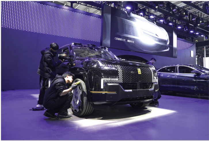
工作人员正在精心调试仰望U8幕布。