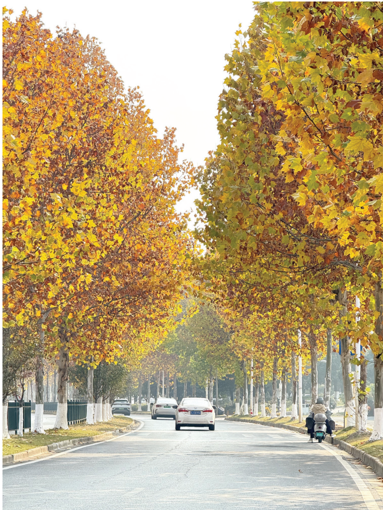
12月11日,浏阳河畔滨河路的梧桐大道。

气象专家提醒,需关注12日开始的寒潮天气过程风力加大对户外设施、农业生产、城市运行安全等的影响,提前做好防风加固工作。同时,关注霾天气和寒潮降温对人体健康的影响,冬季气温起伏较大,易引发流感、呼吸道及心脑血管疾病,需加强健康防护。此外,今天湘中湘南部分地区森林火险气象等级较高,建议加强火点监测及火源管控等工作。