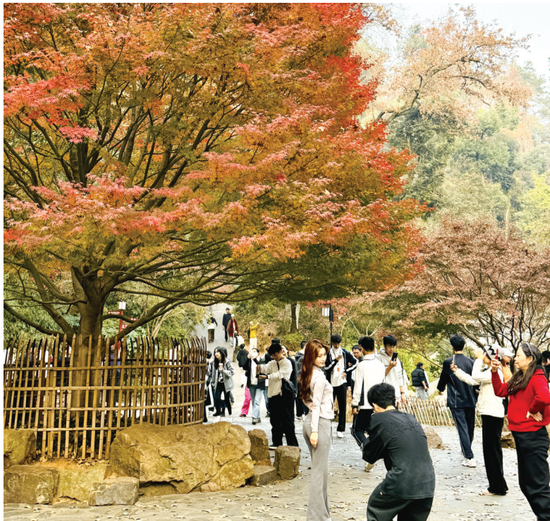
12月11日,市民游客在岳麓山的枫树下拍照。

本报长沙讯 12月以来,随着昼夜温差加大,长沙岳麓山迎来了枫叶最佳观赏期。12月11日,记者在现场看到,穿着汉服的年轻人在枫树下摆着姿势,市民游客在枫树下留影。