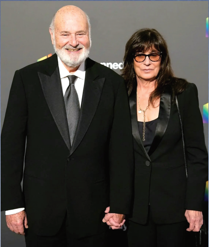
好莱坞知名导演罗伯·赖纳及其妻子米歇尔。