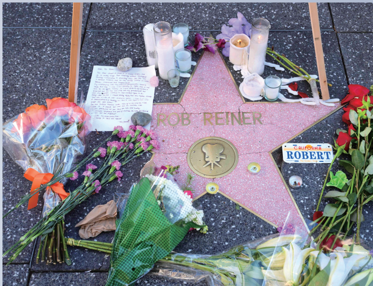
当地时间12月16日,美国加利福尼亚州布伦特伍德,好莱坞星光大道已故美国导演罗伯·赖纳的星形奖章上摆放着鲜花、蜡烛和的一封信,形成一个不断扩大的临时纪念场所。